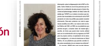
FOTOGRAFÍA DE LA RED DE INVESTIGACIÓN EN SIDA (RIS) EN EL MARCO DEL CONGRESO NACIONAL SOBRE EL SIDA E ITS EN BILBAO, 4-6 OCTUBRE 2022.

La apuesta por contar la ciencia en la RMDs de la Red de Investigación en Sida (RIS) y de la Cohorte CoRIS.