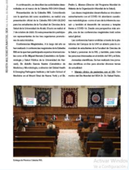
FOTOGRAFÍA DE LA RED DE INVESTIGACIÓN EN SIDA (RIS) EN EL MARCO DEL CONGRESO NACIONAL SOBRE EL SIDA E ITS EN BILBAO, 4-6 OCTUBRE 2022.

La Cátedra RIS, una iniciativa para compartir el trabajo científico de la Red de Investigación en Sida y fomentar las vocaciones científicas en jóvenes. El programa de innovación tecnológica y colaboración entre instituciones al servicio de la prevención del VIH, nace SIPrEP.