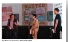
FOTOGRAFÍA DE LA RED DE INVESTIGACIÓN EN SIDA (RIS) EN EL MARCO DEL CONGRESO NACIONAL SOBRE EL SIDA E ITS EN BILBAO, 4-6 OCTUBRE 2022.

Los avances de la investigación científica en el VIH siguen mejorando la calidad de vida de las personas con VIH. En este número de la revista se analizan los últimos avances en el diagnóstico, el tratamiento y la prevención de las infecciones de transmisión sexual (ITS) y se presentan los resultados de los últimos estudios científicos en el campo de la investigación científica en el VIH. La investigación científica en el VIH sigue mejorando la calidad de vida de las personas con VIH. En este número de la revista se analizan los últimos avances en el diagnóstico, el tratamiento y la prevención de las infecciones de transmisión sexual (ITS) y se presentan los resultados de los últimos estudios científicos en el campo de la investigación científica en el VIH.